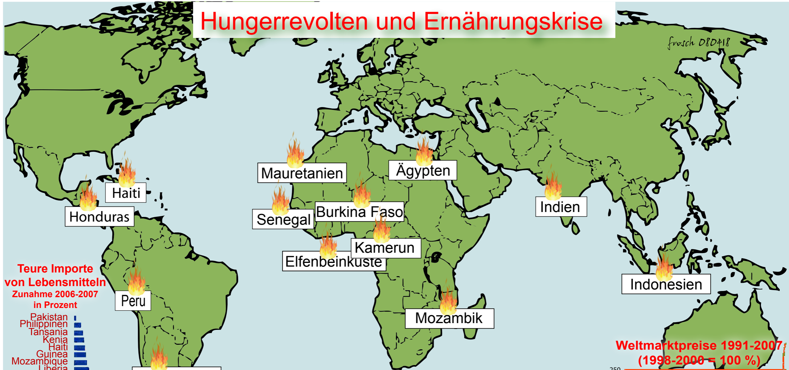
Teure Importe von Lebensmitteln Zunahme 2006-2007 in Prozent